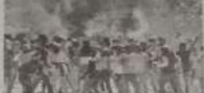
শাসকৰ সাম্প্ৰদায়িক ৰাজনীতি হৈ পৰিছে মূল প্রতিবোধী শক্তি। এই কথাটোৱেই হৈছে 'কা বিবোধী জনজাগৰণ'ৰ মূল কথা। এই জাগৰণই হৈছে অসমত চলি থকা এক বিপ্লৱাত্মক আন্দোলন।